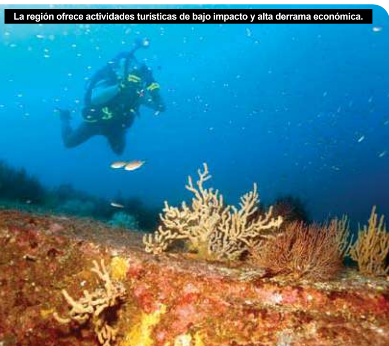
La región ofrece actividades turísticas de bajo impacto y alta derrama económica.

Se requiere un marco legal que fortalezca el desarrollo armónico con el medio ambiente y la población local. También es necesario establecer instituciones paramunicipales con meca-