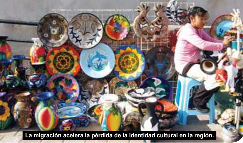
La migración acelera la pérdida de la identidad cultural en la región.

Es crucial que el Noroeste de México desarrolle un turismo competitivo y no cualquier tipo de turismo. De lo contrario, muy pronto algunas localidades como Puerto Peñasco, Sonora, y Loreto, Baja California Sur, enfrentarán la problemática asociada al modelo turístico convencional, como el adoptado por Cabo San Lucas: islas de opulencia en un mar de pobreza, desabasto de agua dulce, carencia de servicios básicos como escuelas y hospitales para la población residente y migrante, y un crecimiento poblacional insostenible (9% anual).